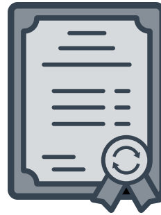
Actas de Entrega-Recepción