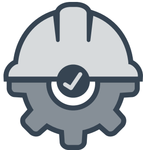
Obras públicas en proceso