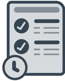
Sesiones y minutas